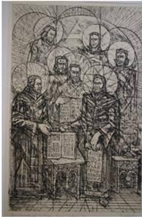
Рис. 4. Петар Чуковский, «Св. Седмочисленники», графика, 1972.