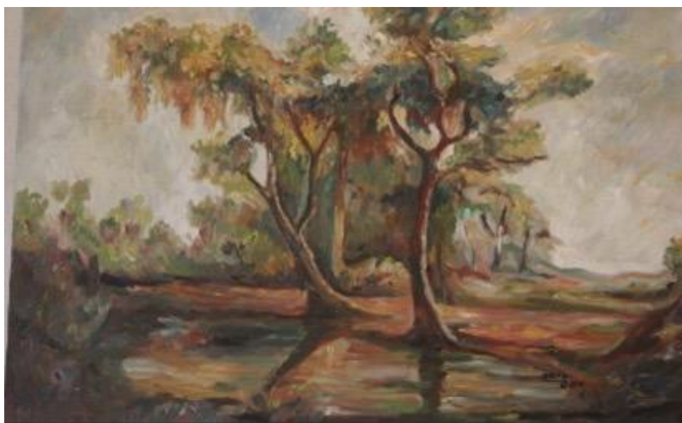
Рис. 3. Папа Жан, «Любовь деревьев», масло, 2002.

Особенно ценными считаем 158 оцифрованных объектов оригинальных картин живописи и рисунков, которые включены в Европейской цифровой библиотеки Europeana, что предоставляет возможности международной презентации уникальной специальной библиотечной коллекции в рамках культурного и исторического наследия Болгарии.